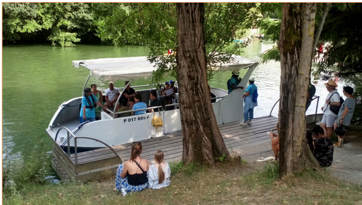
Big Jump 2023 à Saint-Maur-des-Fossés

Par ailleurs, le format des Passeurs de Marne en Seine-Saint-Denis a évolué en 2023. D'un côté, la ville de Noisy-le-Grand a quitté le dispositif tandis que la ville de Neuilly-Plaisance l'a rejoint. Après concertation avec les partenaires, des croisières non-commentées en boucle, au départ de Gournay-sur-Marne et de Neuilly-Plaisance, ont été proposées , au lieu des navettes fluviales. Les balades d'une cinquantaine de minutes ont été commercialisées (5€ par adulte, 2,50€ par enfant) sur ExploreParis et sur place, au niveau des pontons d'accueil. Pour cette première édition qui a comptabilisé 22 jours de navigation, 1 477 passagers ont bénéficié du service. Le format devrait être renouvelé en 2024.