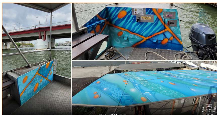
Fresque sur le Catalogue