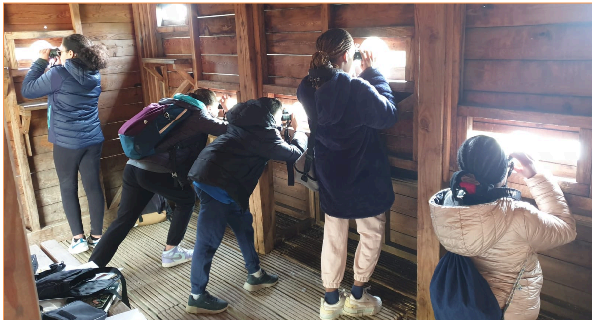
observation des oiseaux au Parc de la Haute-Ile

En 2023, l'association a créé un poste d'animateur en CDI afin de répondre à la hausse des demandes d'intervention de sensibilisation. Celui-ci a été pourvu fin janvier. Aussi, pour la première fois, un poste de médiatrice auprès des populations a vu le jour, dans l'objectif de renforcer la mobilisation des publics en quartier Politique de la ville sur les actions d'éducation à l'environnement. Ce poste, occupé dès le mois de février, est un contrat en adulte-relai. Enfin, le contrat en alternance est arrivé à son terme au mois d'août ce qui a tout de même permis d'assurer un appui en animation pendant les \frac{2}{3} de l'année. Ainsi, 2023 a été une année de renforcement des ressources humaines en lien avec la sensibilisation et à l'éducation à l'environnement.