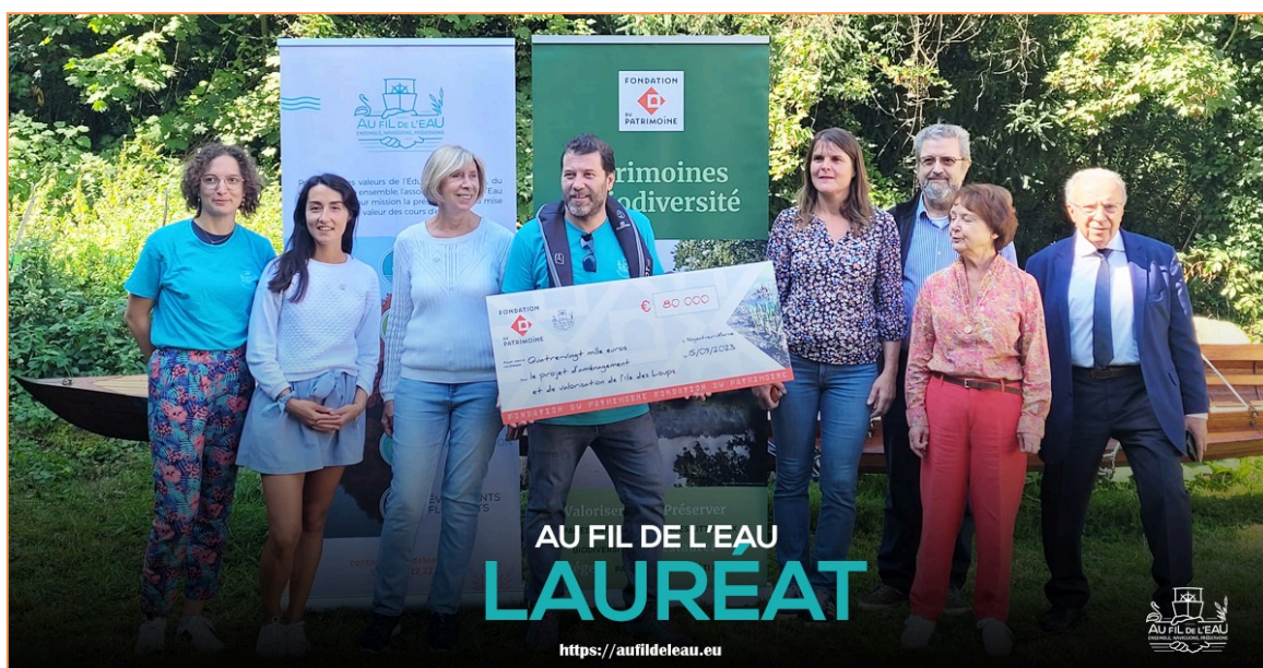
remise de prix de la Fondation du Patrimoine

Dans le cadre d'un marché réservé avec le Département du Val-de-Marne, l'association est intervenue régulièrement sur la Seine et sur la Marne. Aussi, un travail important d'entretien a été réalisé sur l'Île des Loups, située au Perreux-sur-Marne, pour le compte de l'Etablissement Public Territorial Paris Est Marne & Bois. Après deux années de réflexion sur un projet de reconstruction de la ripisylve de l'île, Au Fil de l'Eau a été lauréate de la Fondation du Patrimoine pour mener à bien son plan d'actions en trois ans. Celui-ci est composé d'un inventaire faune/flore 4 saisons, de travaux de restauration écologique, de conception d'un nouveau contenu pédagogique et d'un ensemble de croisières de sensibilisation à destination du public jeune.