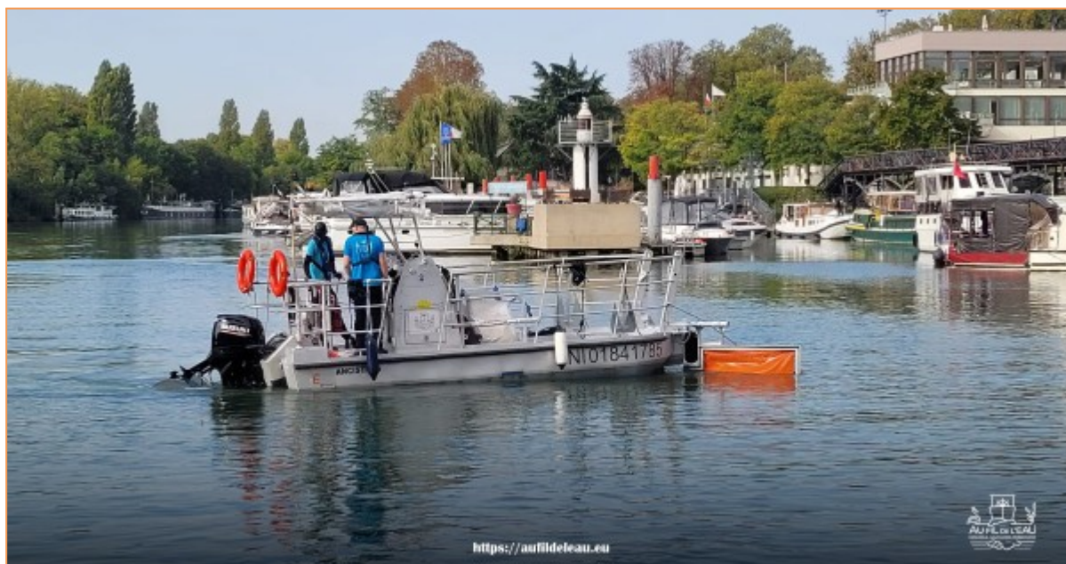
inauguration de l'Ancistrus

Dans cette dimension, le bateau collecteur de déchets L'Ancistrus a été livré en janvier 2023 et inauguré en octobre 2023. Dans le même temps, 3 salariés permanents ont passé leur permis BE (permis remorque) et commencé leur certificat de capacité pour la conduite des bateaux de commerce. Les démarches d'agrément ont été particulièrement lourdes, d'autant plus que le titre de navigation obtenu (engin de chantier) n'est pas celui qui avait été initialement demandé par l'association (bateau professionnel de moins de 20m). L'association est en cours de négociation avec les services de la DRIEAT pour revoir ce point.