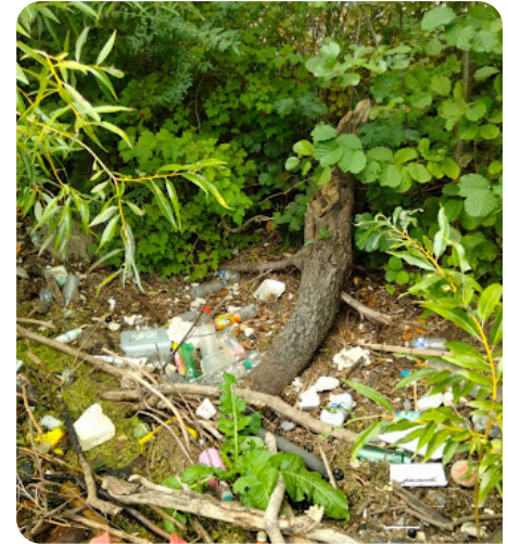
Exemple de déchets flottants.