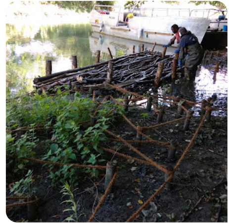
Installation de cordage anti-atterrissement et création d'un peigne pour favoriser le dépôt de sédiments.