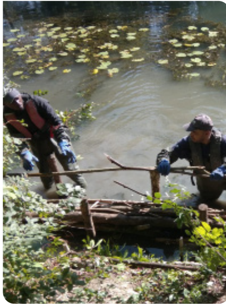
Remplissage des fascines.

ml de rivière faucardée par nos équipes en 2023. Photos entretien végétation