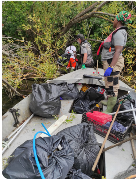
Les salarié·es en transition en action.

tonne de déchets ménagers ramassés par nos équipes en 2023.